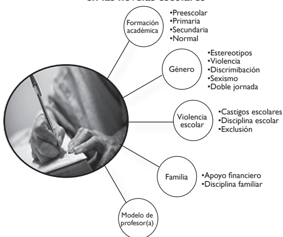
Figura 1. Categorías y subcategorías identificadas en las novelas escolares

Dentro del proyecto iniciamos por localizar y transcribir las pequeñas narrativas escritas, posteriormente se sistematizaron los puntos de coincidencia en los escritos, para construir categorías de análisis e identificar la estructura de las novelas escolares. La primera fase de categorización se ejemplifica en la figura 1.